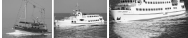
Gehen sich frisch machen: „Hauke“, „Ol Büsum“ und „Lady von Büsum“

Wer Büsum noch mal von außen sehen will, muss sich beeilen: Heute stechen die Ausflugsschiffe der Reede- rei Rahder zum letzten Mal in diesem Jahr in See.