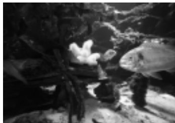
Neben den vielen Aquarien ist besonders das Walskelett Anziehungspunkt im Multimar Wattforum