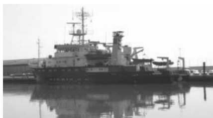
Regelmäßiger Gast in Büsum: Vermessungs- und Wracksuchschiff Wega vom Bundesamt für Seeschifffahrt und Hydrographie

Heute legt die „Hein Mück“ um 13:30, 14:30 und 15:30 ab. Weitere Infos und Abfahrtszeiten unter 04834/3612