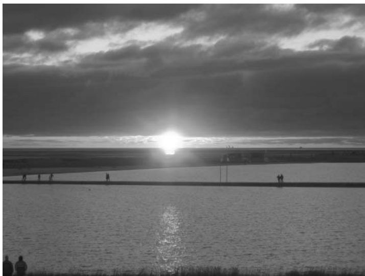
Romantische Lichtstimmung abends am Sandstrand – diesen Eindruck fing unser Leser Simon Lederer aus Kassel für uns ein

Heute um 19:00 Uhr im Vitamaris. Anmeldung unter (0 48 34) 9 09-124