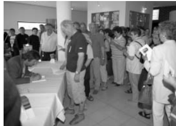
Großer Andrang: Autogrammstunde

z. B. zum Thema Windenergienutzung gute Dienste leisten. Gute Dienste leistete Jörg Kachelmann nach seinen Grußworten sprichwörtlich selbst: Nachdem ein passender Inbusschlüssel besorgt war, beseitigte er kurzerhand einen kleinen Fehler an der Anlage, und wies den für die Wartung zuständigen KTS-Mitarbeiter gleich in die Technik ein. Danach ging es zum „Blanken Hans“ wo schon zahlreiche Autogrammjäger warteten. Auf gewohnt unterhaltsame Weise referierte der Schweizer Meteorologe zum Thema