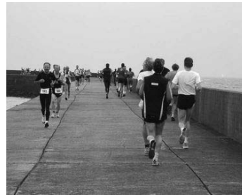
Unten: Jeder Meter Insel wird genutzt: Hafensemole mit Wendpunkt