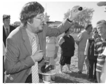
Spontan-Exkurs Technik: Kachelmann erklärt den Niederschlagsmesser

Wetter. Erklärte, wie wichtig lokale Messungen für lokale Vorhersagen sind, wusste manchen hartnäckigen Wetter-Aberglauben zu entkräften und empfahl dem Publikum, seine Laune nicht so sehr vom Wetter abhängig zu machen. Das dem Alpenländer die Küste nicht gänzlich fremd ist, unterstrich er durch einige Anekdoten aus seiner Zeit auf dem Feuerschiff „Elbe I“, wo man seiner Seefestigkeit während eines Orkans mit den Worten „Der Schweizer reihert immer noch nicht“ Respekt zollte.