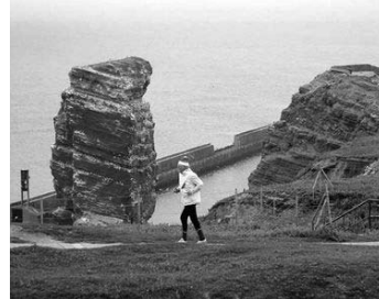
Oben: So eine Kulisse gibt es nicht bei jedem Lauf