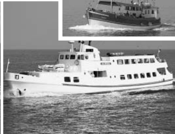
Stechen wieder für Sie in See: „Lady von Büsum“, „Ol Büsum“ und „Hauke“

Sicheres Zeichen für die beginnende Saison ist die Möglichkeit, Büsum auch von der Seeseite bewundern zu können. Ab Samstag steht die frisch überholte Flotte der Reederei Rahder wieder zu diesem Zweck bereit.