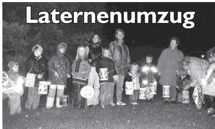
Stolz präsentieren die Kinder ihre selbstgebastelten Laternen ...

600 Jacken für alle Jahreszeiten zur Auswahl ... nur Hohenzollernstraße 14 (neben „Pane Vino“) !!! täglich ab 10 Uhr geöffnet !!! Telefon 04834-965959