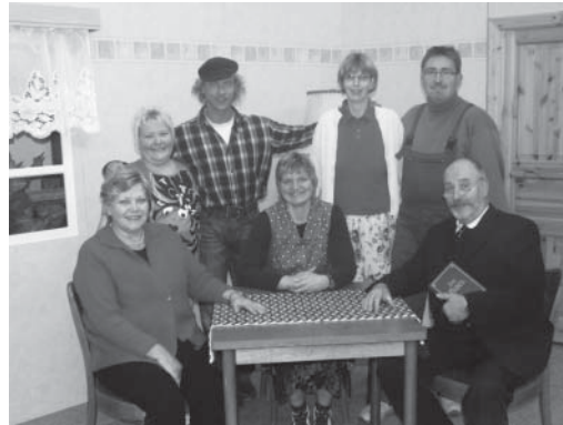
Hofft auf ein volles Haus: Das Ensemble der „Büsumer Speeldeel“