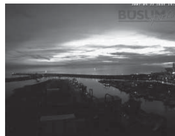
Ob Regenbogen, Wolkenformationen oder Abendstimmung: Immer wieder neue Eindrücke