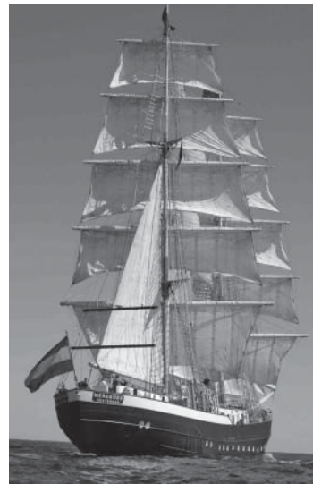
Die Brigg „Mercedes“ ist das jüngste Schiff in der internationalen Flotte der Großsegler. Das 50 m lange Schiff verfügt über 18 Segel mit insgesamt 900 m 2 Segelfläche, die das Schiff bis 16 Knoten (ca. 30 km/h) schnell machen. An Bord ist Platz für bis zu 135 Passagiere.

Wer sich nicht auf sein Glück verlassen will, kann alle Fahrten auch an der Theaterkasse im Gäste- und Veranstaltungszentrum buchen (Tel. 909-114).