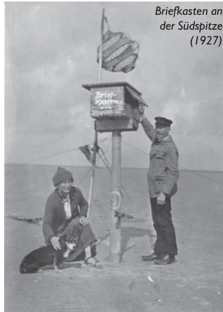
Briefkasten an der Südspitze (1927)

Trotz aller Mühen der Menschen behielt das Meer hier auch später die Oberhand.