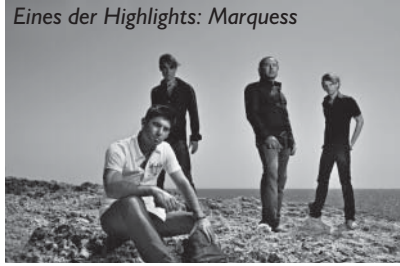
Eines der Highlights: Marquess

Schminkständen und vielen weiteren Attraktionen der zahlreichen Sponsoren und Vereine bieten auf dem Gelände bei der „Sturmflutenwelt Blanker Hans“ in Büsum jede Menge Spaß und Gelegenheit zum Spielen und Toben. R.SH organisiert den Kindertag, der bereits zum fünfzehnten Mal stattfindet, traditionell am ersten Juniwochenende. Jedes Jahr wird eine andere Stadt unter ‚Kinderflagge‘ gesetzt – dieses Mal ist es Büsum. Der Eintritt und alle Showprogramme sind kostenlos und es wird kein Alkohol ausgeschenkt. Der Kindertag mit R.SH ist eine feste Institution in Schles-