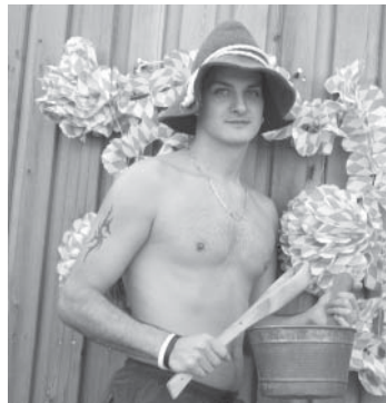
Die Saunameister warten mit deftigen Aufgüsse auf ihre Oktoberfest-Gäste