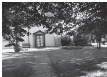
Wer genau hinsieht, findet viele male- rische Details im alten Ortskern

Dass die „Büsumer Wattenlöper“ Bodo und Antonie Spreu sich auch an Land auskennen, beweisen die beiden bei der Ortsführung am Dienstag. Vom Treffpunkt an der Freitreppe am Museumshafen aus geht es um 10:00 Uhr zu einer einstündigen Führung durch Büsum. Einige historische Gebäude wie den „Alten Muschelsaal“, die „Alte Post“ und die Fischerkirche wird man sich