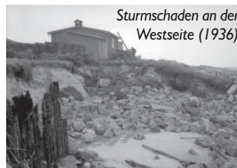
Sturmschaden an der Westseite (1936)

In den 20er Jahren des vergangenen Jahrhunderts wurde ein Teil der Insel eingedeicht und landwirtschaftlich genutzt. Trotz aller Mühen der Menschen behielt das Meer die Oberhand. Die wirtschaftenden Menschen verließen 1943 endgültig die In-