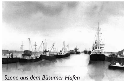
Szene aus dem Büsumer Hafen