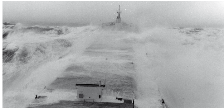
Die Alternativroute zum Nord-Ostsee-Kanal ist manchmal ungemütlich ...

Der Nord-Ostsee-Kanal ist die meistbefahrene künstliche Wasserstraße der Welt: Über 40.000 Schiffe jährlich nutzen die 99 km lange „Abkürzung“ zwischen Nord- und Ostsee, die seit 1895 besteht. Aber auch schon vorher hat die Seeschifffahrt im Bereich der Nord- und Ostsee eine ganz besondere Rolle gespielt, und viele Handelswege hat es bereits in recht früher Zeit zwischen und an den beiden Meeren gegeben. Die Entwicklung aus der Wikingerzeit bis in die Gegenwart über die verschiedensten Kanalprojekte, die Küsten- und Wattenschiff-