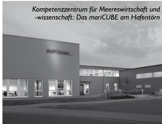
Kompetenzzentrum für Meereswirtschaft und -wissenschaft: Das mariCUBE am Hafentörn