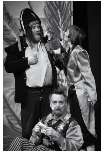
Big Shorty in Bedrängnis

Das können Annie und ihr Captain, die berühmte Piratin Mary Read, nicht auf sich beruhen lassen und nehmen die Verfolgung auf. Klar, dass dieses Abenteuer nicht ohne Seeschlacht, gefährliche Seeungeheuer und mächtiges Säbelrasseln auskommen kann. Das Theater Zeitgeist e.V. aus Plön wird mit mehreren Schauspielern dieses besonderes Piraten-Stück im Seminarraum des „Blanken Hans“