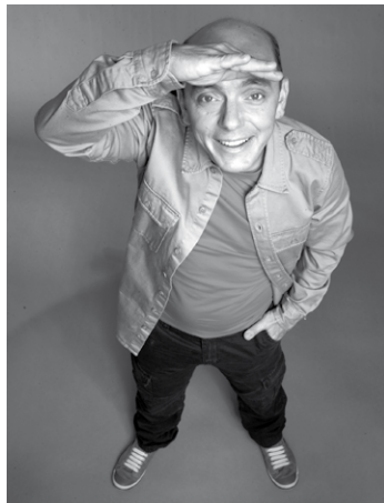
Will Ihre Wahrnehmung von Büsum verändern: Comedian Bernhard Hoëcker

„Sag mir wo du herkommst und ich sag dir wer du bist!“. Selten hat sich jemand diese allgemein gültige Floskel so zu Eigen gemacht, wie Bernhard Hoëcker. Auch wenn es bei ihm eher heißt: „Ich sag Euch wo Ihr herkommt und Ihr wisst dann wie ich bin!“. Seit er auf der Bühne steht, stellt der neugierige Comedian Fragen zu Land und Leuten. Und dieser besondere Aspekt bildet nun die originelle Basis seines neuen Soloprogramms: „Netthamseshier“ Denn jeder Ort hat seine Besonderheit,