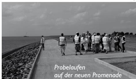
Probelaufen auf der neuen Promenade

Büsum bekommt in den kommenden Jahren ein ganz neues Gesicht: Am Sandstrand sind die Arbeiten schon weit fortgeschritten. Im Zuge der Deichver-