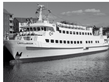
Die „Lady von Büsum“ am Ankerplatz

Infos zu diesen und weiteren Touren unter 04834-3612