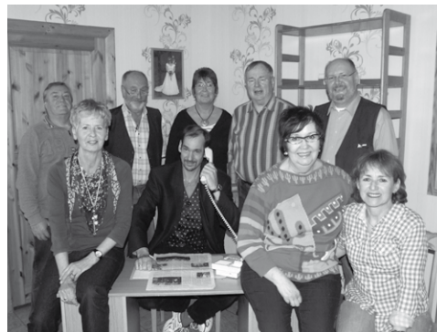
Das Ensemble der Büsumer Speeldeel

Heute Abend führt die „Büsumer Speeldeel“ wieder ihr neues Sommerstück „Filou blifft Filou“, auf.