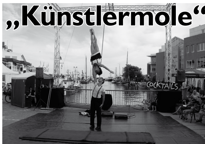
Die Mischung aus Artistik und Ambiente macht den Reiz der Künstlermole aus

Eines der Highlights der Festwoche „175 Jahre Nordseebad Büsum“ ist sicherlich das Straßenkünstlerfestival „Künstlermole“, das von heute bis Sonntag am Museumshafen seine Zelte aufgeschlagen hat. In dieser Zeit macht das bunte Künstlervolk den Museumshafen bis zum Ankerplatz zur Bühne für Artisten, Gaukler und Mimen. Zwischen 12 und 22 Uhr an allen Tagen zeigen verschiedene Straßenkünstler und Variété-Artisten zehn Shows täglich. Besuchen Sie den Platz der Ar-