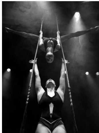
Wiener Walzer am Trapez: das Duo Supanova

Ernesto the Magnifico schließlich, wurde „als Stuntman geboren“ und bringt mit der Big Great Stunt Show Groß und Klein zum Staunen.