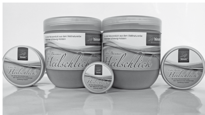
Saubere Sache: Büsumer Heilschlick als praktisches Pulver

Viele Büsum-Urlauber lassen sich während ihres Aufenthalts mit Nordseeschlick behandeln. Gerade bei Menschen mit Hauterkrankungen, Gelenksbeschwerden und Muskelverspannungen bringt dieses Naturprodukt oft Linderung. Aufgrund der positiven Wirkungen kam dabei oftmals der Wunsch auf, diese heilsame Substanz mit nach Hause nehmen zu können.