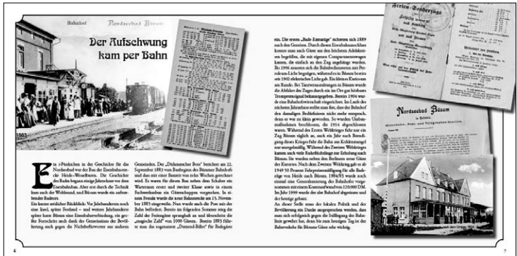
Texte, Bilder und Zeitdokumente – hier zur Geschichte der Eisenbahnverbindung

„Büsum – 175 Jahre Nordseebad“ anhand vieler Bilder und Zeitdokumente. Erhältlich für 7,90 Euro im Buchhandel, vielen Zeitschriftenregalen und bei der Tourist-Information. Auswärtigen Gästen senden wir die Festschrift gern versandkostenfrei gegen Rechnung zu. Klüwerbung Werbeagentur & Verlag e. K., Trischenweg 12, 25761 Büsum, Tel. 04834/960480 info@kluewerbung.de