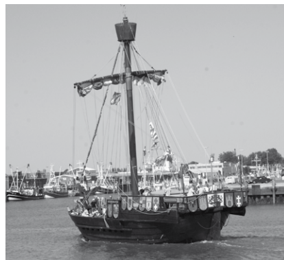
Mitsegeln möglich: die Ubena von Bremen

Ein besonderer Gast macht heute im Büsumer Hafen fest: Die „Ubena von Bremen“ ist die Nachbildung einer Hansekogge aus dem 14. Jahrhundert. Vorbild war ein im Schlamm der Weser gefundenes Wrack, das heute restauriert im Schiffahrtsmuseum Bremerhaven zu sehen ist.