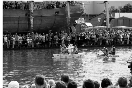
Ein echter Publikumsagnet: Das Papierbootrennen

Einen Tag vor den Kuttern lockt eine weitere skurrile Wettfahrt die Zuschauer an: Beim mittlerweile 6. Papierbootrennen gilt es, die nur aus Papier, Pappe, Kleister und Leim gebauten Boote, über eine Strecke von 400 m durch das Hafenbecken 2 zu rudern und möglichst ohne Schiffbruch zu erleiden, wieder an Land zurück zu kehren. Die drei schnellsten und das schönste Boot werden prämiert. Bisher sind 8 Boote gemeldet. Neu in diesem Jahr ist der vom Baumarkt Zimmermann