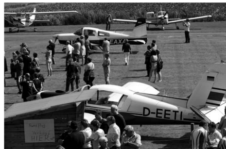
Einfach mal in die Luft gehen ...

Der Flugsportclub Heide-Büsum e.V. veranstaltet am Wochenende seine beliebten Familien-Rundflugtage auf dem Flugplatz in Oesterdeichstrich. Die Maschinen des