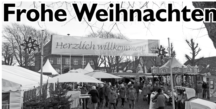
Ab 2. Weihnachtstag wieder offen: Büsumer Winterzauber

Den Jahreswechsel am Meer zu verbringen, wird immer beliebter. Entsprechend erwacht auch Büsum aus seiner Winterruhe und stellt sich auf den Ansturm ein. Für alle die schon das Weihnachtsfest hier verbringen haben wir die wichtigsten Öffnungszeiten auf Seite 3 zusammengetragen. Am 1. Weihnachtstag geht es noch recht besinnlich zu. Die