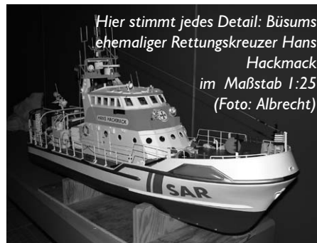
Hier stimmt jedes Detail: Büsums ehemaliger Rettungskreuzer Hans Hackmack im Maßstab 1:25

Von Rettungskreuzern über Krabbenkutter bis zu Containerschiffen und U-Booten. In einem kleinen Wasserbecken