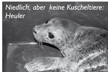
Niedlich, aber keine Kuschteltiere: Heuler

In den letzten Wochen sind im Watt vor Büsum vermehrt sogenannte „Heuler“ aufgefunden worden. Dabei handelt es sich um Seehundbabys, die von ihren Muttertieren allein gelassen wurden.