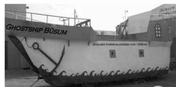
Büsum Ahoi: Das neue Narrenschiff wird am Samstag getauft

Fern. Narrenprominenz aus der Region ist mit und ohne Pappnase herzlich eingeladen. Der BKV stellt bei dieser Gelegenheit auch sein neues Narrenschiff vor, das vom Prinzenpaar in närrischem Rahmen getauft wird. Es gibt viele lustige maritime Spiele (z.B. Gummistiefel-Zielwurf) mit tollen Preisen. Auch die kleinen Gäste kommen an diesem Tag nicht zu kurz.