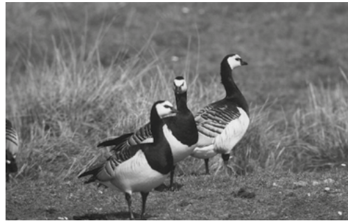
Nonnengänse im Deichvorland auf den Salzwiesen