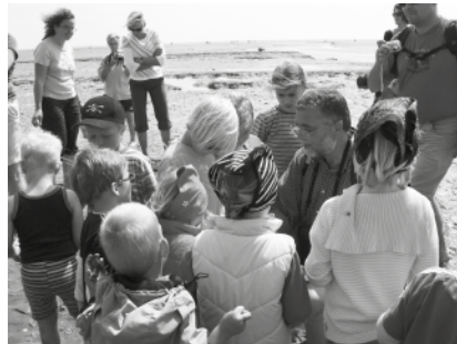
Das „Rohmaterial“ für ihre Bastelarbeiten finden die Kinder im Watt

Naturerlebnis, Basteln und Lernen verbindet die Kreativ-Wattführung der „Büsumer Wattenlöpvers“, Antonie und Bodo Spreu. Am Freitag um