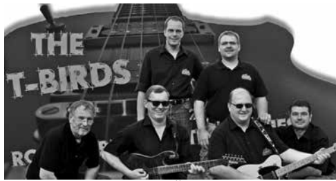
Spielen am Samstag in Österdeichstrich: The T-Birds (oben) und IN2PARTS (rechts)