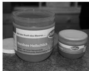
Saubere Sache: Heilschlick als praktisches Pulver

Viele Büsum-Urlauber lassen sich während ihres Aufenthalts mit Nordseeschlick behandeln. Gerade bei Menschen mit Hauterkrankungen, Gelenksbeschwerden und Muskelverspannungen bringt dieses Naturprodukt oft Linderung. Aufgrund der positiven Wirkungen kam dabei oftmals der Wunsch auf, diese heilsame Substanz mit nach Hause nehmen zu können. Das Team vom Gesundheits- und Thalassozentrum Vitamaris hat darauf reagiert und bietet ab sofort den originalen Schlick zum Mitnehmen an – in pulverisierter Form, verpackt Bechern zu 50 g, 240 g oder 1000 g (240 g reichen für ca.