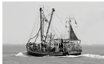
Schönste Kutter: Südwind (oben) und „De Lüttje“ (rechts)

Den zusätzlich ausgespielten Firmen-Cup holte sich ebenfalls der „Dressen-Torpedo“.