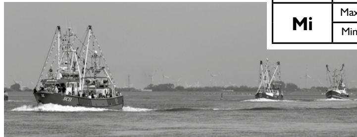
Schon vor der Wendemarke konnte sich die „Anne-Gret“ deutlich absetzen

Die SC 11 „Anne Gret“ gewann die 112. Büsumer Kutterregatta mit 45 Min, 55 Sec. Zweit und drittschnellster wurden SD 1 „Doggerbank“ (50:01) und SC 43 „Anna Catherina“ (50:03). Schnellster in Klasse B wurde SD 23 „Andrea“ (48:04) vor SC 57 „Südwind“ (48:37) und SC 34 „Dithmarschen“ (49:15).