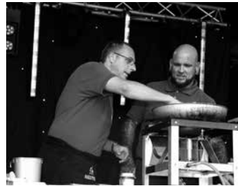
Darf nicht fehlen: Schaukochen mit dem Stüürmann-Team

Nach der Veranstaltung steigt ab 23 Uhr in der ehemaligen Diskothek „Ocean“ (Am Bauhof I) eine After-Show-Party.