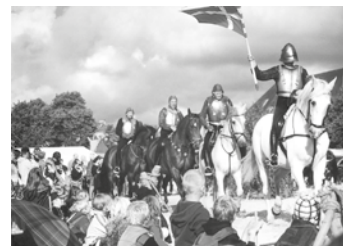
Szene des Freilichtspiels „Sag dem König Gute Nacht“

Einen Zeitsprung von gut 500 Jahren kann man an diesem Wochenende in Heide machen: Zum „Heider Marktfrieden“ verwandelt sich Deutschlands größter Marktplatz für vier Tage in ein mittelalterliches Dorf mit Händlern und Gauklern, Spielern und Handwerkern. Ein Freilichtspiel mit über 100 Akteuren kündigt davon, wie die Dithmarscher im Jahre 1500 das dänische Heer besiegt haben. Weitere Attraktionen sind der Festumzug am Sams-