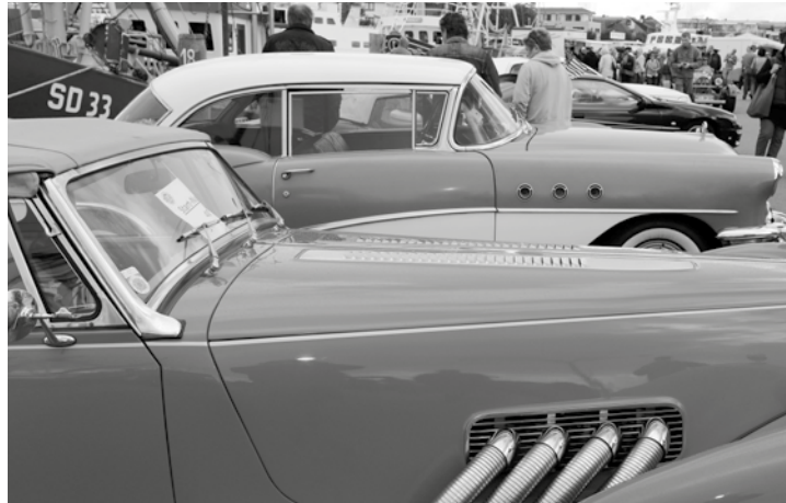
Automobile Träume aus Chrom, Blech, Leder und Lack sind am Sonntag wieder hundertfach am Hafen zu bewundern mehr auf Seite 2