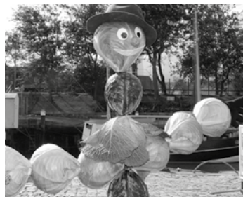
Wer das Gewicht des Kohlmannes errät, kann tolle Preise gewinnen

Nach der Eröffnung durch die Kohlregentin, Gemeinde und Dehoga am Samstag um 10:45 Uhr folgt ein buntes Unterhaltungsprogramm für jung und alt mit Dithmarscher Handwerk und Brauchtum. Für musikalische Unterhaltung sorgen Der Musikzug Blau-Weiß Wesselburen, die Büsumer Reetdänzer, de Büttpedders, der Nordseechor, Ingo Branden-