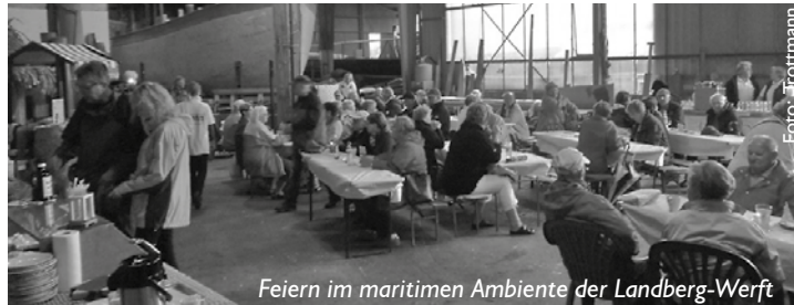
Feiern im maritimen Ambiente der Landberg-Werft

Wie jedes Jahr zum Ende des Sommers feiert der Museumshafenverein sein Herbstfest auf der Bootswerft Landberg. Alle Interessierten sind dazu herzlich willkommen. Es gibt Kaffee, selbstgemachten Kuchen, Bier und Wein. Außerdem stellt ein heimischer Künstler