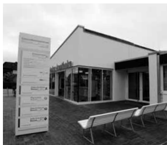
Die Praxis befindet sich im Gesundheitszentrum an der Westerstraße

In der Saison steht in Büsum eine Zentrale Anlaufpraxis für Notfälle außerhalb der Sprech-