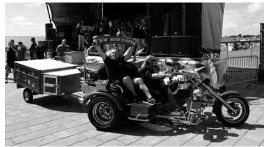
Auch wieder dabei: Das Stüürmann-Team mit dem „Kochmobil“

Bei diesem Fest treffen sich nicht nur Gäste und Einheimische – hier reisen das gesamte Umland und viele ehemalige Büsumer an. Über 100 ehrenamtliche Helfer sind daran beteiligt, dieses Fest auf die Beine zu stellen.