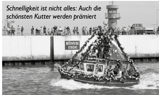
Schnelligkeit ist nicht alles: Auch die schönsten Kutter werden prämiert

Das kommende Wochenende steht ganz im Zeichen von Büsums größtem Saisonspektakel: Die Kutterregatta macht den Hafen für drei Tage zur Partymeile. Als Höhepunkt der Veranstaltung wird nicht nur der schnellste Kutter ermittelt, sondern auch der schönste. Wer es wird, liegt mit etwas Glück in Ihren Händen: Wir suchen 6 Urlauber als Jury-Mitglieder, die über den schönsten Kutter dieser Regatta befinden. Alles was Sie brauchen, sind ein paar