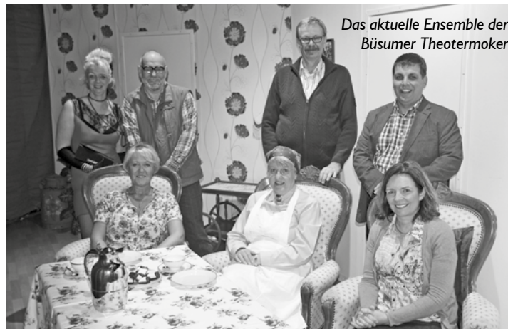
Das aktuelle Ensemble der Büsumer Theotermoker

Am Mittwoch um 20 Uhr hebt sich im Gäste- und Veranstaltungszentrum der Vorhang zu „Dree Engel für Helmfried“, dem neuen Stück der Büsumer Theotermoker.