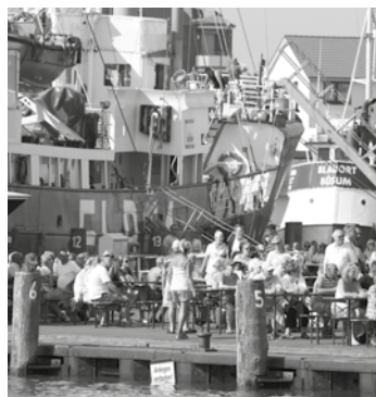
Hafenatmosphäre hautnah erleben