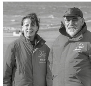
Die Büsumer Gästelotsen

Jeden Montag um 10 Uhr informieren die Büsumer Gästelotsen im Museum am Meer (Am Fischereihafen 19) über Neues und Wichtiges für einen angenehmen Urlaub in Büsum. Die Teilnahme ist nicht nur für Gäste interessant, welche ihren ersten Urlaub hier verbringen, sondern auch für langjährige treue Gäste. Geboten wird ein Überblick über Neuerungen und Veränderungen im Ort sowie über Veranstaltungen der kommenden Tage. Die Gästelotsen geben nicht