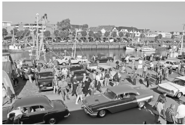
Automobile Träume aus Chrom, Blech, Leder und Lack sind am Sonntag wieder hundertfach am Hafen zu bewundern mehr auf Seite 2