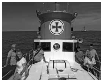
Die „Büsum-Spontan“-Leserjury an Bord der „Rickmer Bock“