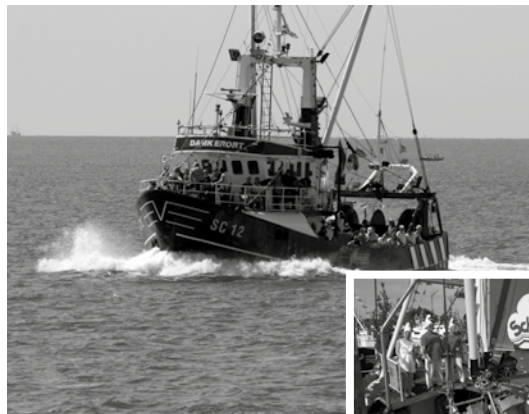
Rechts: Schönster Kutter wurde die „Doggerbank“, diesmal von den Schlämpfen besiedelt wurde