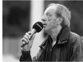
Rollo Fuhrmann

Ein ganz besonderer Gast beehrt den TSV Büsum am Mittwoch im Stadion Rosengrund: Das Punktspiel gegen den IF Stjernen Flensburg kommentiert kein Geringerer als Rolf „Rollo“ Fuhrmann, Reporter-Legende und früherer Sky-Kommentator. Den prominenten Besuch hatte der Verein schon im letzten Jahr mit einem kreativen Bewerbungsvideo bei der Aktion „Holt euch den Rollo“ des Fußballportals Sportbuzzer gewonnen. Der bereits für den 18. November geplante Besuch