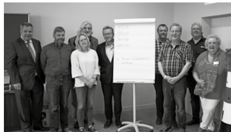
Die Jury bei der Vorauswahl der Namensvorschläge

Nach der Online-Abstimmung steht das Ergebnis fest: Das Büsumer Gäste- und Veranstaltungszentrum wird nach Neueröffnung „Watt'n Hus – Freizeit- und Informationszentrum“ heißen. Anfang des Jahres hat die Tourismus Marketing Service Büsum GmbH dazu aufgerufen, Namensvorschläge für das gerade im Umbau befindliche Gäste- und Veranstaltungszentrum einzureichen. Eine Jury hat aus über 200 Einsendungen