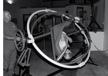
Nur was für Schwindelfreie: der Astronauten-Trainer

Erfahrene Guides sind dabei immer vor Ort, erklären die einzelnen Experimentierstationen und die physikalischen Zusammenhänge. Ein Prinzip steht jedoch immer im Vordergrund: Durch den Spaß an der Sache entsteht echtes Edutainment