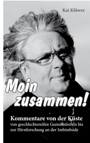
Kommentare von der Küste von geschlechtsreifen Gummistiefeln bis zur Hirnforschung an der Imbissbude