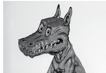
Achten Sie bei Ihrem Besuch unbedingt auf diesen Drachen

Phänomania Büsum Dr.-Martin-Bahr-Str. 7 Geöffnet tägl. 10-18 Uhr (letzter Einlass 17 Uhr) Eintritt: Erwachsene € 9,50 Schüler 6-17 Jahre € 7,50 Kind 4-5 Jahre € 6,50