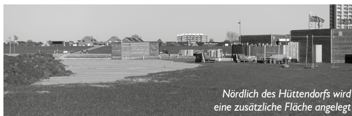
Nördlich des Hüttendorfs wird eine zusätzliche Fläche angelegt

Die Arbeiten werden voraussichtlich Mitte Mai abgeschlossen sein. Da das Hüttendorf ebenfalls schon aufgebaut wurde, steht das Gelände dann für die touristische Nutzung – soweit erlaubt – wieder zur Verfügung.