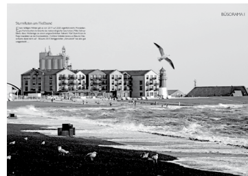
Ein kleiner Blick ins neue Heft (dort sind die Fotos natürlich farbig)

Büsumer Bullauge Ausgabe 2020, 92 Seiten ISBN 978-3-9815580-1-2, € 8,- Erhältlich im örtlichen Buch- und Zeitschriftenhandel www.buesumer-bullauge.de