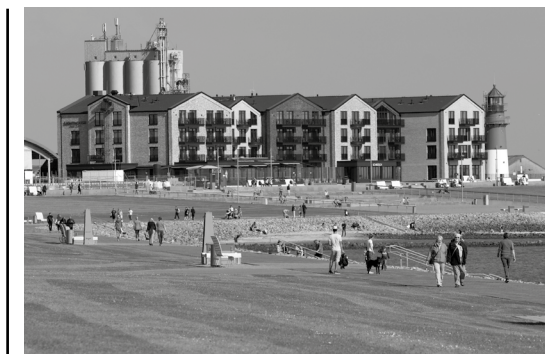
Abstand halten – damit das gelingt, wurde der Tagestourismus eingeschränkt