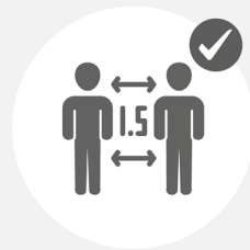
Mindestabstand 1.5 Meter