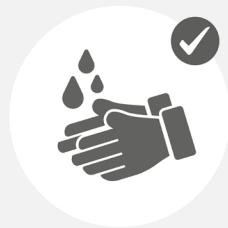
Mind. 20 Sekunden Hände waschen

Daher ist Urlaub in Büsum jetzt nur mit verantwortungsbewusstem Handeln und mit Einschränkungen möglich.