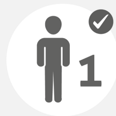
Alleine einkaufen, ein-/auschecken

Auf diese Einschränkungen werden Sie sich einstellen müssen: In Hotels, Restaurants, Geschäften und bei Veranstaltungen gibt es Maßnahmen zur Einhaltung von Mindestabständen und der Regulierung der Gästezahl.